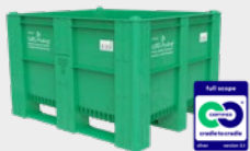
WBG-Pooling-BigBox 1000 green