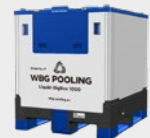
WBG-Pooling-Liquid -BigBox 1000 grey