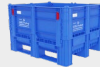
WBG-Pooling-BigBox 1000 foldable blue