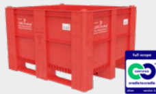
WBG-Pooling-BigBox 1000 red