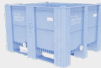
WBG-Pooling-BigBox 1000 drain 605L light blue