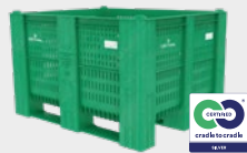
WBG-Pooling-BigBox 1000 perforated green