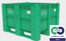
WBG-Pooling-BigBox 1000 green