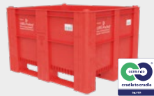
WBG-Pooling-BigBox 1000 red